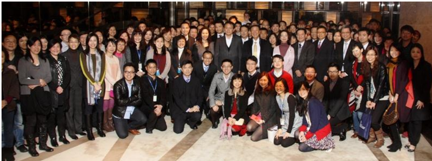
图3：集团定期举行团队建设工作坊，加强沟通，激发新意念