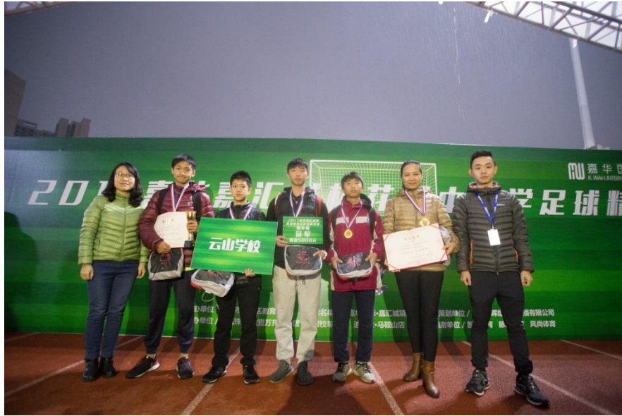
(初中組冠軍：雲山學校)

嘉華國際冀望通過“嘉華嘉匯城盃”賽事為足球愛好者提供一個能展示自我的平台，促進團隊協作精神的鍛煉與培養之餘，亦增強青少年對足球的興趣，為建設及推動區內中小學體育事業的發展作出貢獻。