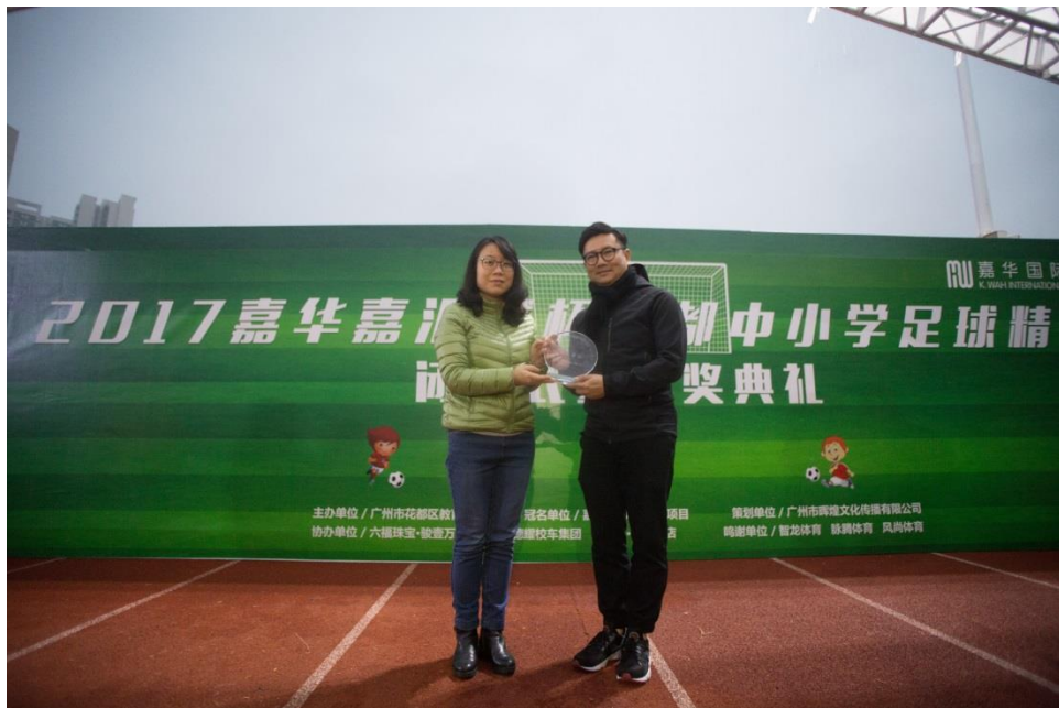
(花都區教育局領導向嘉華國際代表頒發紀念獎牌)

嘉華國際冀望通過“嘉華嘉匯城盃”賽事為足球愛好者提供一個能展示自我的平台，促進團隊協作精神的鍛煉與培養之餘，亦增強青少年對足球的興趣，為建設及推動區內中小學體育事業的發展作出貢獻。