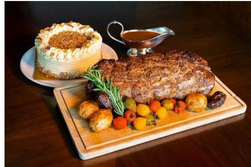
盛夏 ● 烧西冷牛肉（外带）