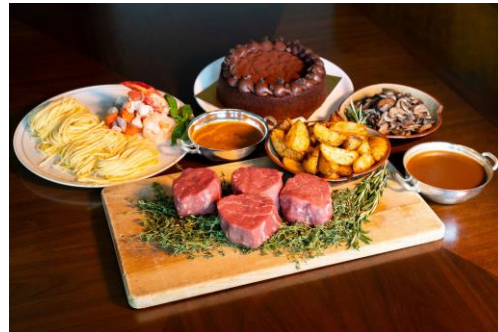
Theo Randall 招牌菜单（自煮套装）