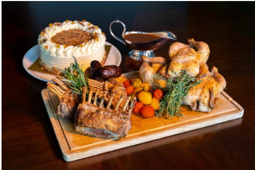
盛夏 ● 烧羊架及春鸡（外带）