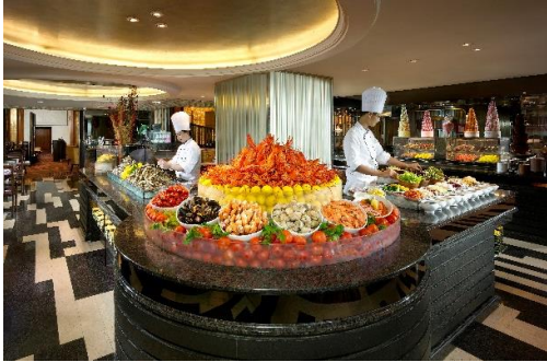
海景咖啡廊 4 人晚市自助餐

图 1- 6：海景嘉福酒店之电子餐饮礼券可换领的丰富奖品（每份价值 2,000 港元），奖品数量有限，换完即止。