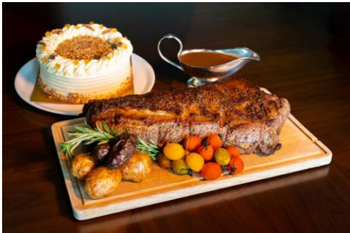
盛夏 ● 烧肉眼牛肉（外带）